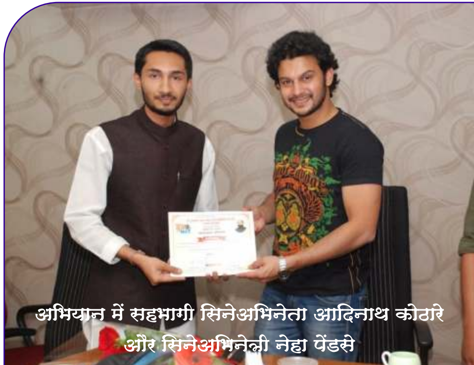
अभियान में सहभागी सिनेअभिनेता आदिनाथ कीरारे और सिनेअभिनेत्री नेहा पेंडसे