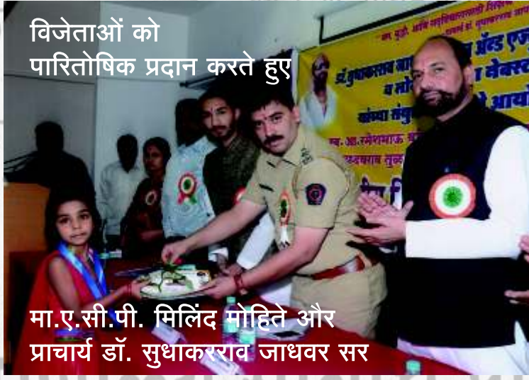
विजेताओं को पारितोषिक प्रदान करते हुए