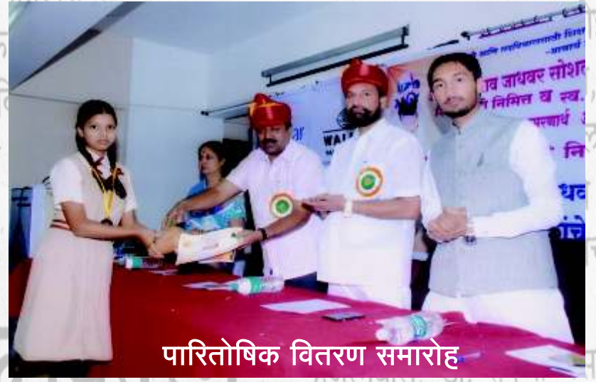
पारितोषिक वितरण समारोह