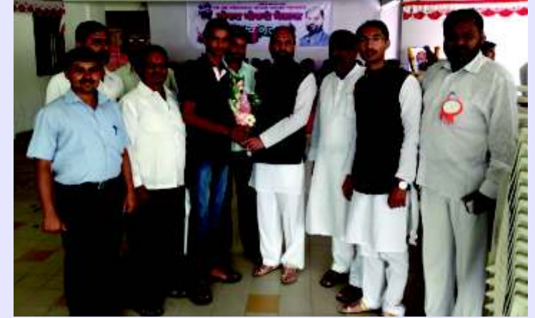
रीजगार सम्मेलन में पहले रीजगार छात्र का सम्मान करते हुए