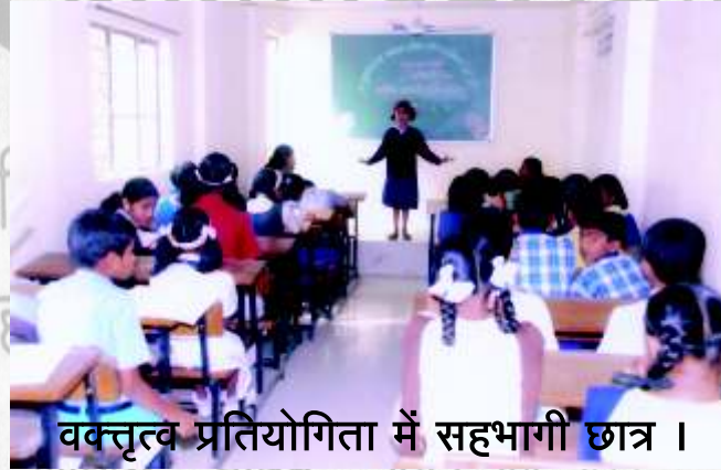
वक्तृत्व प्रतियोगिता में सहभागी छात्र ।